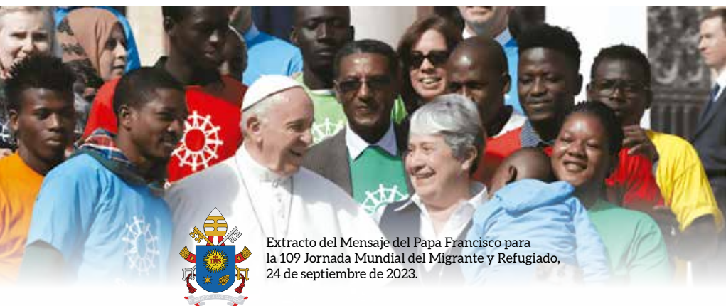
Extracto del Mensaje del Papa Francisco para la 109 Jornada Mundial del Migrante y Refugiado, 24 de septiembre de 2023.

El camino sinodal que, como Iglesia, hemos emprendido, nos lleva a ver a las personas más vulnerables —y entre ellas a muchos migrantes y refugiados— como unos compañeros de viaje especiales, que hemos de amar y cuidar como hermanos y hermanas. Solo caminando juntos podremos ir lejos y alcanzar la meta común de nuestro viaje.