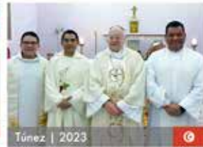
Túnez | 2023