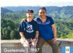
Guatemala | 1987

Ustedes han caminado a nuestro lado, siendo el pilar fundamental en esta obra misionera; agradecemos su compromiso, y, sobre todo, su amor por nuestro Instituto.