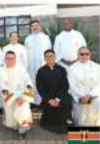
Hong Kong | 1975