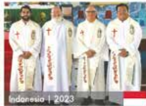
Indonesia | 2023